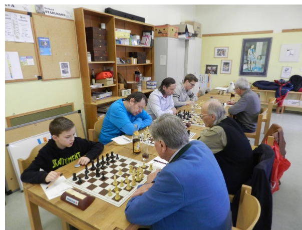
ASK Evergreen – 8. Runde 2. Klasse Nord

Herbert baute sich eine Gewinnstellung auf, verlor aber durch Klappenfall, weil er nicht auf die Zeit geachtet hat.