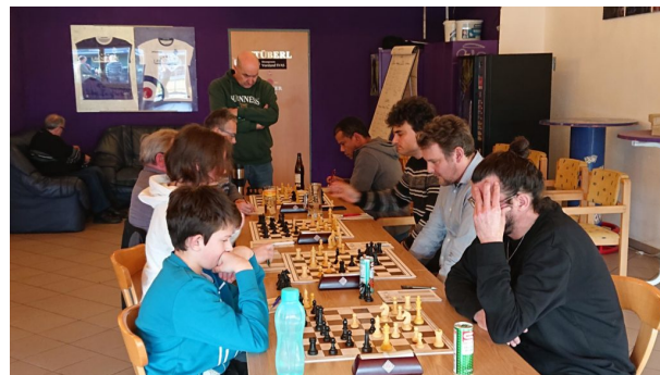
ASK Komet – Neumarkt