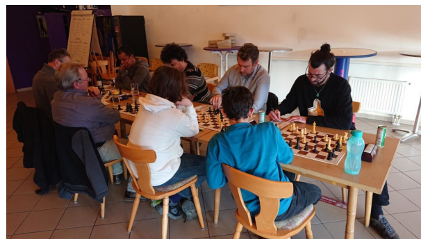
ASK Komet – Neumarkt