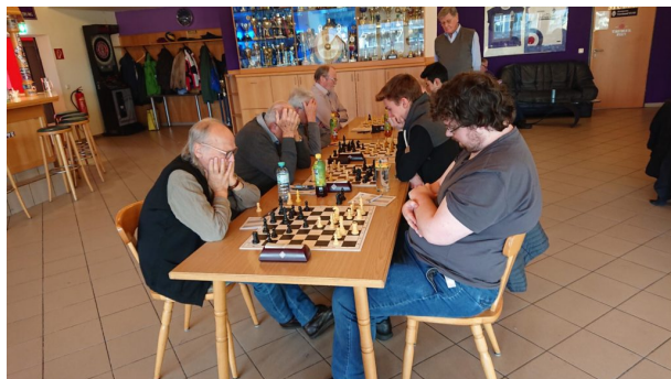
ASK Evergreen – SIR Lehrer