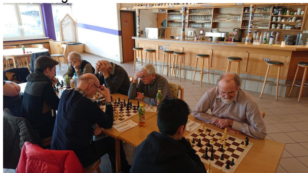
ASK Evergreen – SIR Lehrer