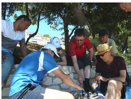
Nach dem Spiel wurden die Partien analysiert und die beste mit einem Punkt für den Pula-Superstar-Wettkampf prämiert.