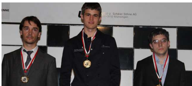
Alexander Morozevich, Magnus Carlsen und Maxim Vachier Lagrave.