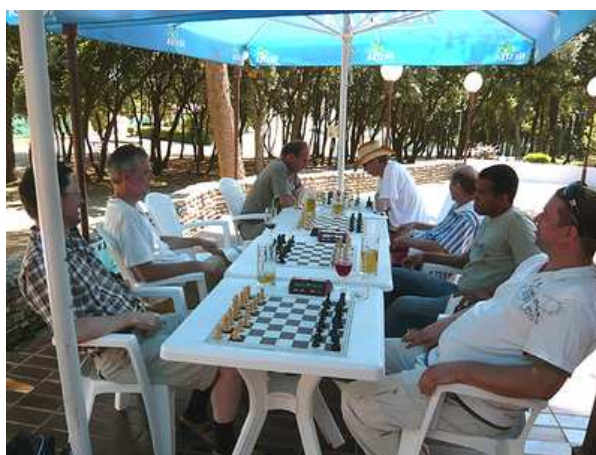
...auch das Blitzturnier trugen wir ebendort aus.