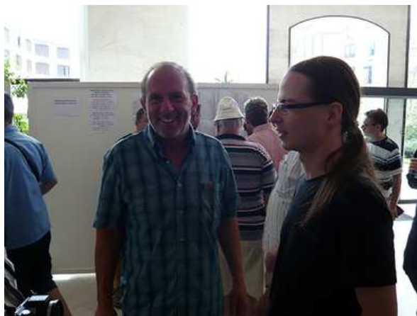
Groß die Vorfreude jedes mal auf die anstehende Partie - die Atmosphäre war aber sehr locker.