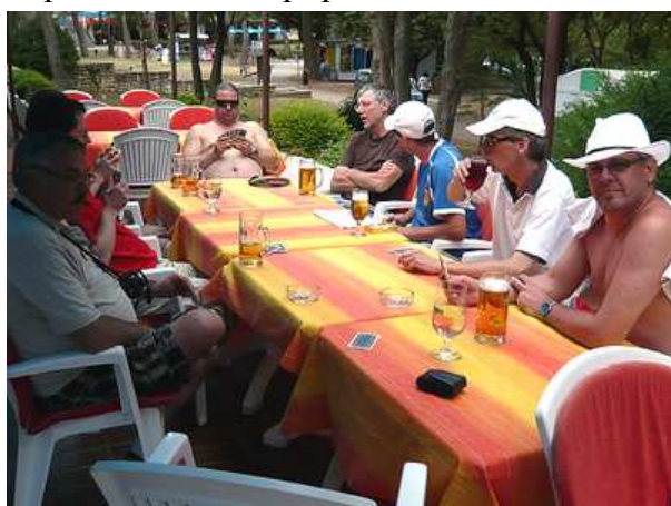
Das "Sportcafe" machte seinem Namen alle Ehre - hier beim "Pikeln"-Kartenspiel.