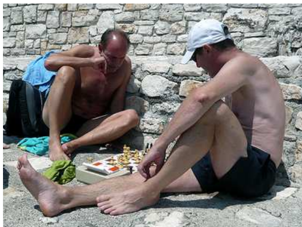
Vor jeder Runde, die meistens um 16:30 begonnen, gab es eine Trainingseinheit am Strand.