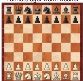
Runde 3: Position 510