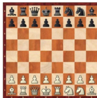
1. Runde: Position 883