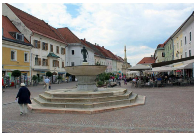
Der Stadtplatz von St. Veit an der Glan