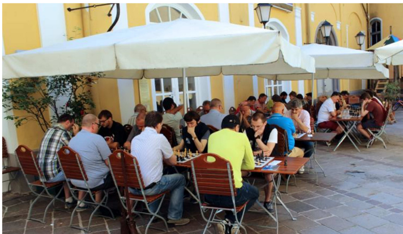
Die Mehrzahl der Partien wurde dieses Mal im Innenhof der Brauerei Kaltenhausen gespielt

Von den 5 Teams des ASK konnte sich die Landesligamannschaft ASK 1 im Mittelfeld behaupten, die Teams ASK UNKIEN, ASK Post SV und ASK Young Stars landeten geschlossen am Tabellenende.